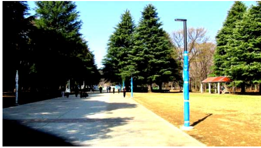
林の先は工事中・その先左手が桜の園