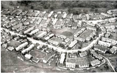
ワシントンハイツの頃

3月は代々木公園で桜観にと。同園は井伊家下屋敷・代々木練兵場・終戦後にはワシントンハイツとなり米軍の士官宿舎800戸として占有された。1964年に東京オリンピック時に都民のための公園として変身し、公園南側は代々木体育館として賑わっている。