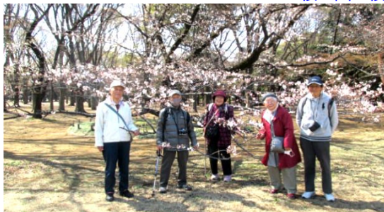
桜の園で記念撮影