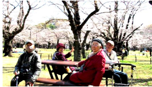
桜の園西端部で一休み

桜の園の西端部でベンチに座り一休み。犬好きの人達のパーティーが桜を楽しんでいる。犬も桜の美しさを解るのだろうか。